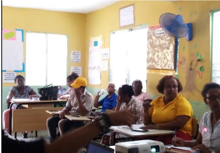
Reunión con docentes para informar sobre las transferencias