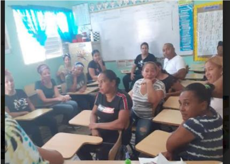
Reunión con los padres para elegir la sociedad civil