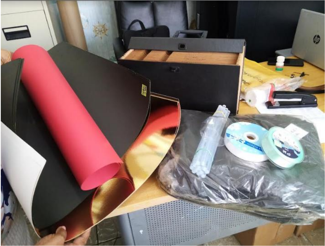
Compra de materiales gastables