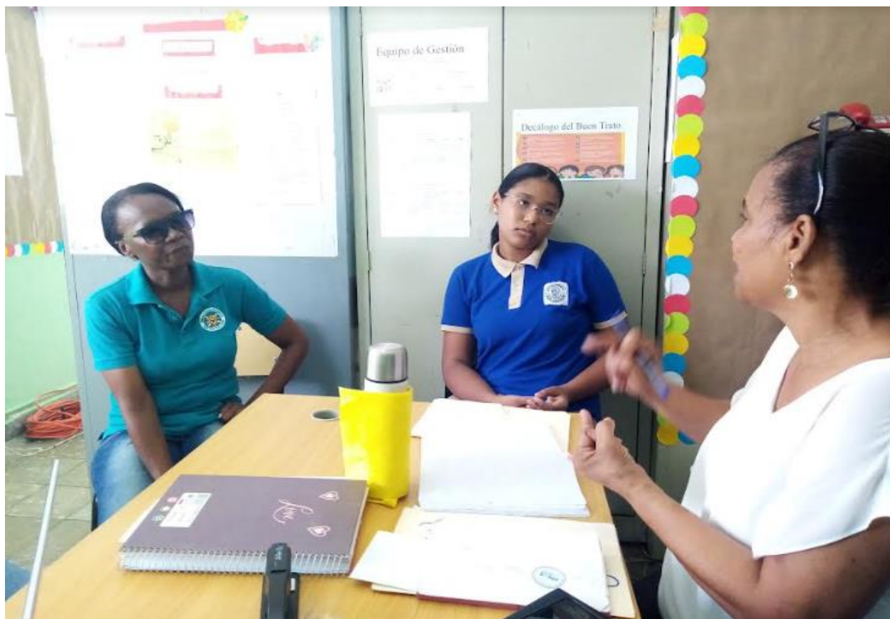
Reunión con la tesorera y la representante estudiantil de la junta