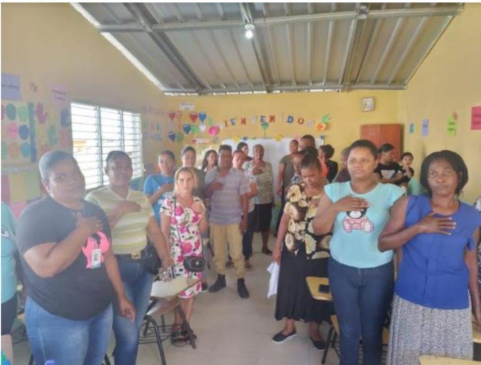
Juramento de la sociedad de padres