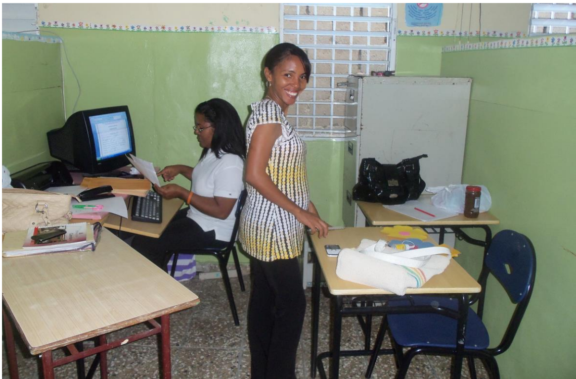
Fotos de la primera dirección antes de la llegada de transferencias