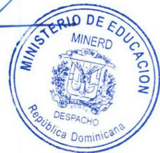
ANDRÉS NAVARRO GARCÍA Ministro de Educación

Dada en la ciudad de Santo Domingo de Guzmán, Distrito Nacional, capital de la República Dominicana, a los veinticuatro (24) días del mes de marzo del año dos mil dieciocho (2018).