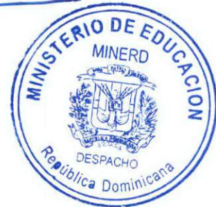
ANDRÉS NAVARRO GARCÍA Ministro de Educación

Dada en la ciudad de Santo Domingo de Guzmán, Distrito Nacional, capital de la República Dominicana, a los veinticuatro (24) días del mes de marzo del año dos mil dieciocho (2018).