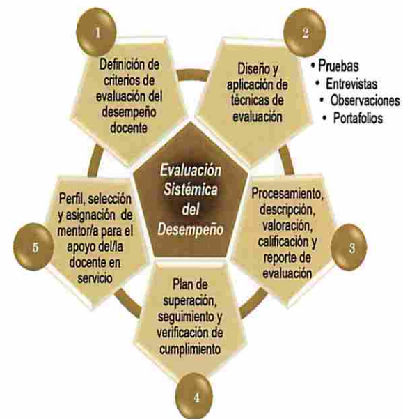
Figura 2: Componentes del Proceso de Evaluación Sistemática del Desempeño Docente

En general, la aplicación de los Estándares es clave para examinar el profesionalismo y su aplicación efectiva en el desempeño de funciones docentes definidas y establecidas oficialmente en el marco curricular de la educación preuniversitaria dominicana. Incluye a todos los cargos y categorías docentes, con implicaciones para la gestión, liderazgo, provisión de apoyo y desarrollo profesional. La Figura 2 muestra los componentes del proceso evaluativo en que se aplican los Estándares y sus correspondientes indicadores, evidencias verificadoras y escala de valoración y calificación del desempeño docente: