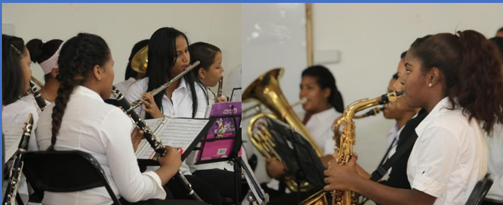
Ilustración 2, Banda de Música, centro Educativo Santa Ana