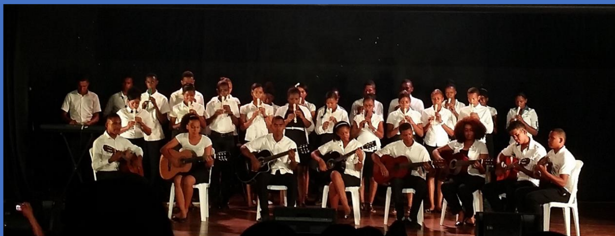
Ilustración 1 Agrupación de música, Centro Educativo Manuel Felix Peña.

Versión Preliminar para Revisión y Retroalimentación