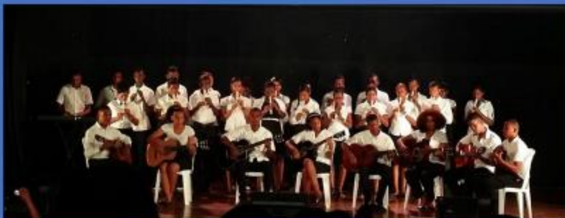
Ilustración 1 Agrupación de música, Centro Educativo Manuel Félix Peña.

Versión Preliminar para Revisión y Retroalimentación