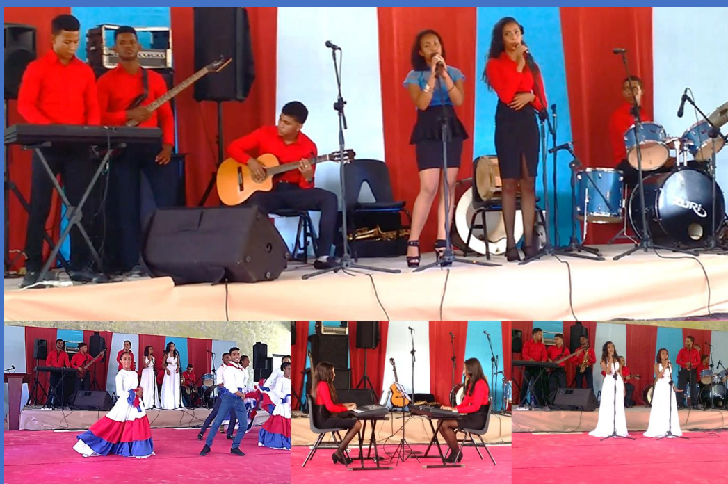
Ilustración 5 Grupo de Música, Centro Ramon Agustín Corcino