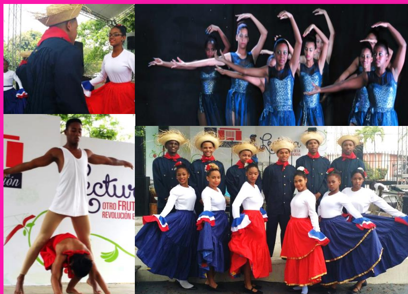
Ilustración 2 Agrupacion de Danza de los Centros Educativos de la Modalidad en Artes.