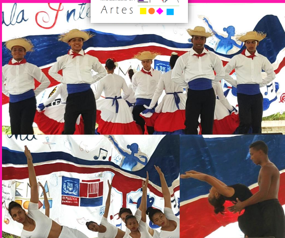
Ilustración 1, agrupaciones de danza de los Centro Educativo Fabio Amable Mota.

Versión Preliminar para Revisión y Retroalimentación