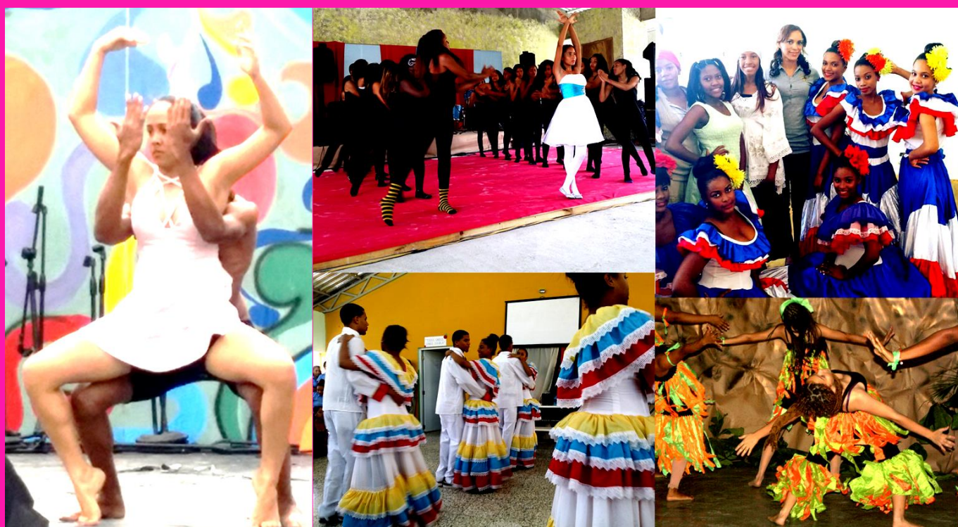
Ilustración 4 Grupo de danza, Centros educativos Modalidad en Artes.