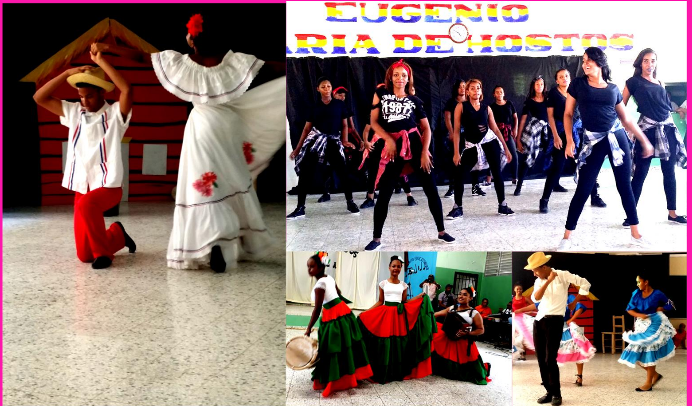
Ilustración 5 Grupo de danza, Centros educativos Modalidad en Artes.