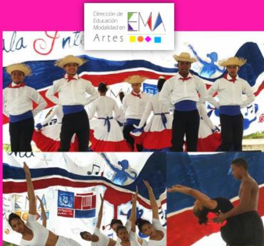
Ilustración 1, agrupaciones de danza de los Centro Educativo Fabio Amable Mata.

Versión Preliminar para Revisión y Retroalimentación